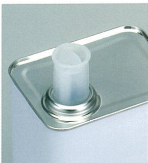
ノズルを出した状態