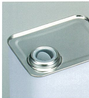
ノズルを入れた状態

合成樹脂製品は通常熱に弱く、加熱された乾燥炉を通したり、熱い蒸気に触れたりした場合に寸法が変わりますのでご注意ください。